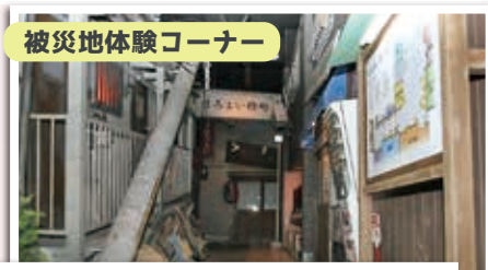
被災地体験コーナー