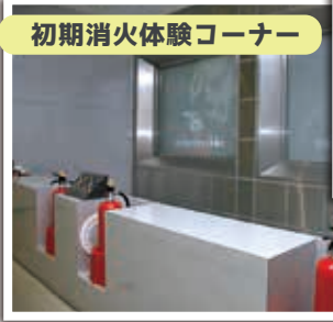
初期消火体験コーナー