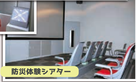
防災体験シアター