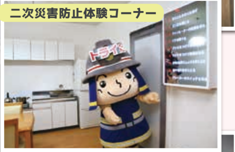
二次災害防止体験コーナー