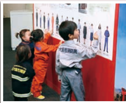
待望の子ども用制服なども登場予定!!

「5月頃リニューアルを予定」 防災学習センターでは、展示内容のリニューアルを予定しています。リニューアル後は、未就学児のみなさん向けのコンテンツを増やし、家族で防災に取り組みやすい施設にパワーアップします。リニューアル後にご期待ください。