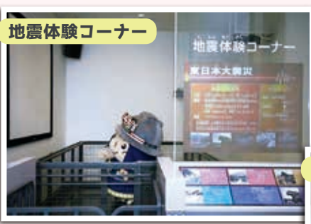
地震体験コーナー

アルに体験できる市内唯一の施設、しかも無料で入館できます。また、自主防災会や自治会など団体で利用していただく、「共助」の精神も高まります。事業所では社員研修、学校では防災教育にピッタリな施設、是非ともご利用ください。