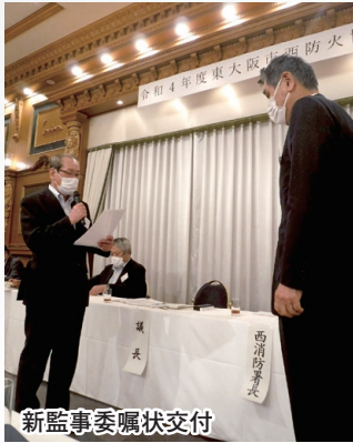
新監事委嘱状交付

を多くの方に知って頂く為のホームページの作成や、規約の改正等を進めてまいりました。また、会費の改正につきまして、会員の皆様のご理解を頂きますと、大変有難うございました。さて、本日の総会では、令和3年度事業報告と収支決算報告及び令和4年度事業計画(案)と収支予算(案)等を審議していただきます。総会がスムーズに進行できますように、皆様のご協力をお願いいたします。そして、総会終了後には、会員相互の親睦と西消防署の幹部の皆様との親睦を深めて頂く懇親会を開催させて頂きますので、よろしくお願ひします。結びに、皆様のご事業のご発展と、皆様とご家族と社員の皆様のご健勝とご多幸を心より祈念申し上げて、開会のご挨拶とさせていただきます。本日はどうぞよろしくお願ひします。本年度の私の抱負を披露させて頂くことをもって、開会のご挨拶とさせていただきます。