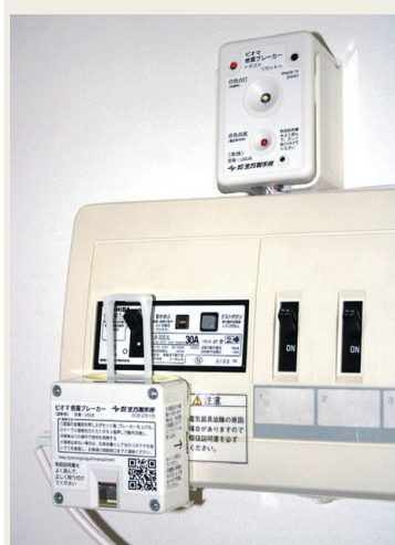
▲感震ブレーカー（簡易型）の写真▶

地震のとき、電気機器や配線の損傷、倒れた電気ストープなどにより火災になる場合があります。実際に東日本大震災のときに原因が特定できた火災の過半数は、電気が原因でした。何より怖いのは、地震発生直後に停電となり、そのまま避難することです。電気が復旧すると、損傷した機器や配線、倒れたストープに電気が流れて火災になることがあります。